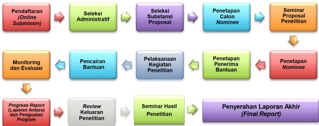
Gambar Alur (Proses) Pengelolaan Bantuan Penelitian Berbasis Standar Biaya Keluaran

Tahapan dan penjelasan masing-masing proses bantuan penelitian berbasis standar biaya keluaran ini, dapat dilihat pada gambar di bawah ini.